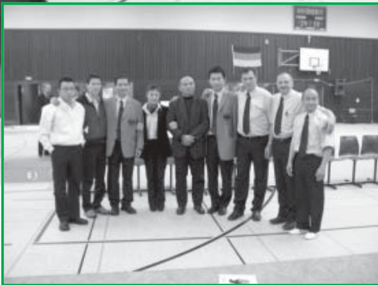
Alle Platzierten der Internationalen Wushu-Meisterschaften (oben); links die Kampfrichter