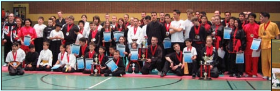
Gruppenfoto der Gewinner