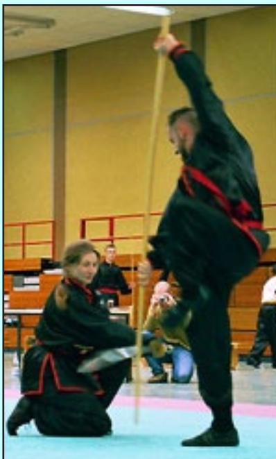
Traditionelle Partnerkampf Formen