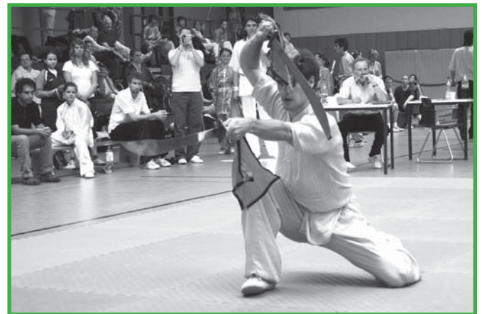
Traditionelle Form Doppelsäbel