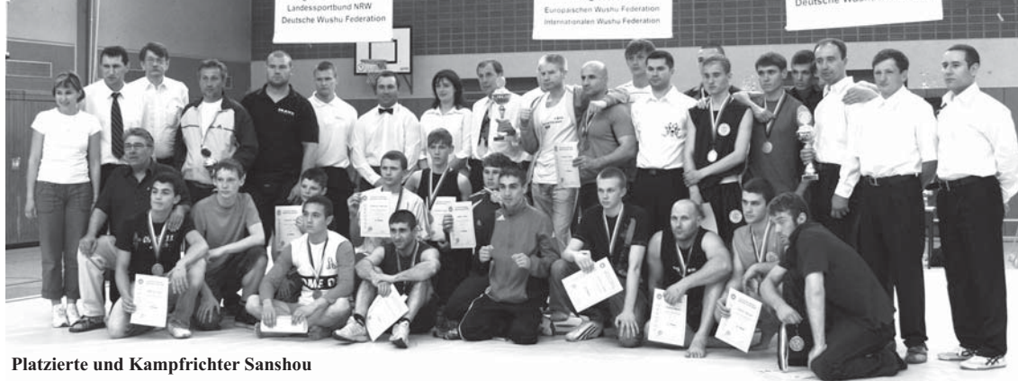
Platzierte und Kampfrichter Sanshou