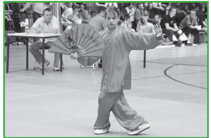
Traditionelle Fächerform U 14