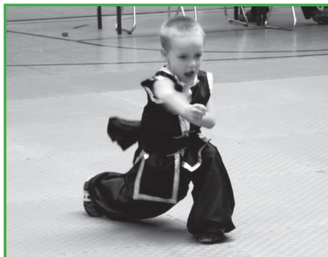
Nanquan U 11