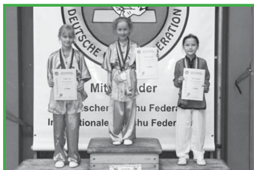
Siegerehrung Changquan U 11